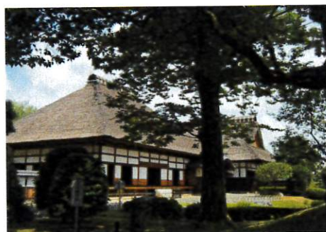
足利学校イメージ

6/6までにお申し込みください。 尚、日にちが過ぎてしまった場合でも一度、当社へお問い合わせください。 ご予約は、メール、お電話もしくは、お申し込み用紙にご記入の上FAXにて受付けております。